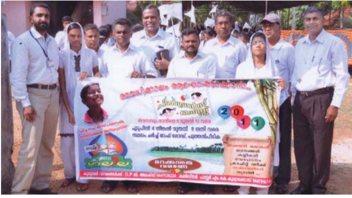
വി.ബി.എസ്സ്. പത്തനംതിട്ട ഡിസ്ട്രിക്ടിന്റെ വി.ബി.എസ്സ്. റാലിയുടെ മുൻ നിര ദൃശ്യം