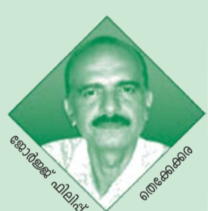
ജോർജ്ജ് ഫിലിപ്പ് തിരക്കേക്കൂടെ