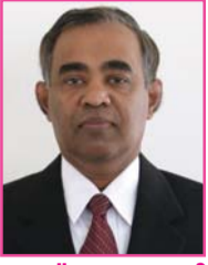
ടീയെസ്. കപ്പമാംമുട്ടിൽ (അരിശോണ)