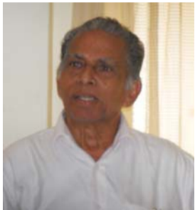
കാനം അച്ചൻ ചർച്ച നയിക്കുന്നു

തിരുവല്ല: പെന്തക്കോസ്ത് സഭകളിൽ വർദ്ധിച്ചുവരുന്ന ദുരുപദേശ പ്രചരണങ്ങളെയും വികലമായ വചന വ്യാഖ്യാനങ്ങളെയും എതിർക്കുവാനും യഥാർത്ഥ വചന സത്യത്തിലേക്ക് ജനത്തെ നടത്തുവാനും ബോധവൽക്കരിക്കുവാനും വിവിധ പെന്തക്കോസ്ത് സഭകളിലെ എഴുത്തുകാർ, പത്രപ്രവർത്തകർ, പ്രസംഗകർ എന്നിവരുടെ സംയുക്തവേദിയായ പെ