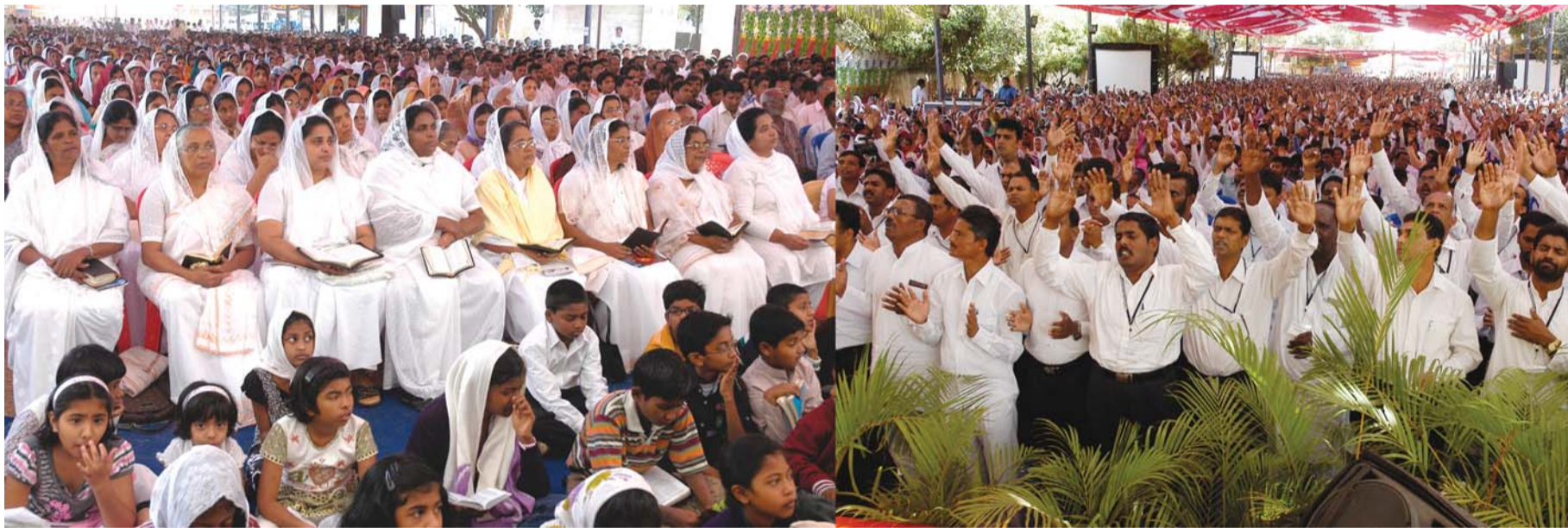
കൺവൻഷനിൽ പങ്കെടുത്ത വിദ്യാസിങ്കൾ