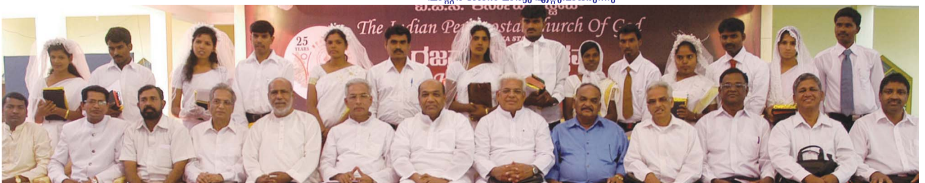
നവ ദമ്പതികൾ സ്റ്റേറ്റ് എക്സിക്യൂട്ടീവ് സിനോഡോം