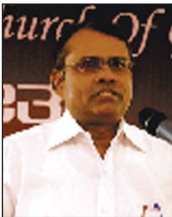
പാ നൂറുറ്റിൻ മുളള