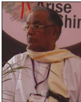
പാ പോൾ വർക്കി