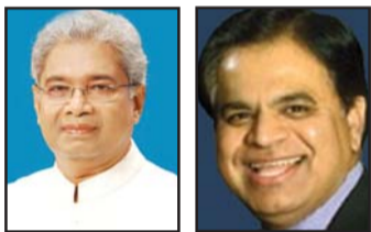
റൽ കൗൺസിൽ കമ്മീഷനെ നിയമിച്ചതോടെ പുതിയ തലത്തിലേക്ക്

കുവനാട്: നിലമ്പൂരിൽ നടന്ന കേരളാ സ്റ്റേറ്റ് ഐ. പി. സി. കൺവൻഷനിലെ ജനപങ്കാളിത്വവും വിജയവും കണ്ട് ഹാലിളകിയ ജനറൽ കൗൺസിലുകാർ കൺവൻഷൻ കടിഞ്ഞാണിടുവാൻ നടത്തിയ നീക്കങ്ങളോടെ കലുഷിതമായ അന്തരീക്ഷം മലബാർ റീജിയൻ രൂപീകരണത്തിന് മുന്നോടിയായി ജന