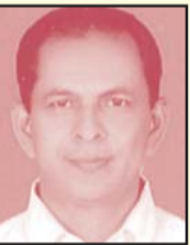
എം. ഇ. ബേബി