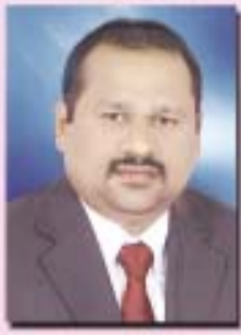
വിദ്യാഭ്യാസ സെക്ഷൻ ഡയറക്ടർ (സെക്ഷൻ ചെയർമാൻ)