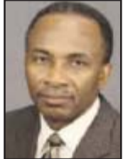
ബിഷപ്പ് ഇസ്മായേൽ ചാൾസ്