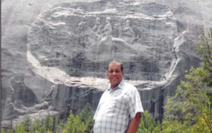
ലേഖകൻ അറ്റ്ലാന്റയിലെ സ്റ്റോൺ മൗണ്ട് പാർക്കിൽ