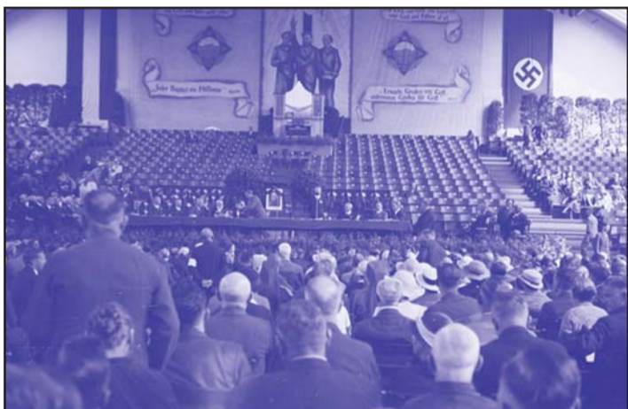
1934-ൽ ബർലിനിൽ നടന്ന ബാപ്റ്റിസ്റ്റ് വേൾഡ് അലയൻസ് കോൺഗ്രസിൽ സുസ്തിക പതിച്ച നാസിപതാക ഉയർത്തിയിരിക്കുന്നു