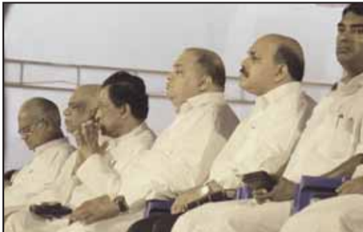
കേരളാ സ്റ്റേറ്റ് നേതൃത്വം