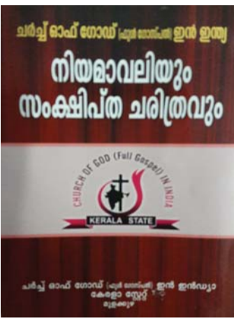
വ്യവസ്ഥാപിതമായ മാർഗ്ഗം സഭാ നേതൃത്വം ഇതു വരെ ആരാഞ്ഞിട്ടില്ല. അതാതു കാലങ്ങളിൽ അപ്മാ

വിശ്വാസികളുടെ വോട്ടവകാശം എന്ന ആവശ്യത്തിന് പതിറ്റാണ്ടുകളുടെ ചരിത്രമുണ്ട്. ഒട്ടനവധി നിവേദനങ്ങളും കേസുകളും ഇതിന്റെ പേരിൽ നൽകിയിട്ടുണ്ട്. എന്നാൽ ഈ വിഷയം പരിഹരിക്കാനുള്ള