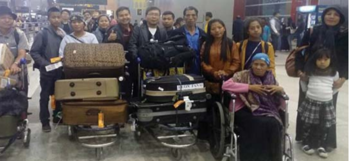
ബിനയി മനശെ യഹൂദ സംഘം ഡൽഹി ഇന്ദിര ഗാന്ധി ഇന്റർ നാഷണൽ എയർപോർട്ടിൽ യിസ്രായേലിലേക്കുള്ള വിമാനത്തിനായി കാത്തിരിക്കുന്നു.

അസറിയൻ സാമ്രാജ്യത്തിന്റെ കാലയളവിൽ മനശെ ഗോത്രം പ്രവാസത്തിലേക്ക് പോയത്. 27 നൂറ്റാണ്ടുകൾക്ക് ശേഷം ഇവരെ വടക്ക് - കിഴക്കൻ സംസ്ഥാനങ്ങളിൽ കണ്ടുകിട്ടിയത്. ഇത് സാമൂഹ്യ ശാസ്ത്രജ്ഞർക്ക് ഒരു പ്രഹേളികയാണ്. സിൽക്ക് റൂട്ട് വഴി അനേകം രാജ്യങ്ങൾ സഞ്ചരിച്ച് ഇവർ മണിപ്പൂരിലും, മിസോറാമിലും എത്തിയെന്ന് കരുതുന്നു. 1980, 90 -കളിൽ ചെറിയ സംഘങ്ങളായി ഇവർ യിസ്രായേലിൽ കുടിയേറി എങ്കിലും 2000-ന് ശേഷമാണ് വലിയ തോതിൽ കുടിയേറ്റം ആരംഭിച്ചത്. ശെവായി യിസ്രായേലാണ് ഇവർക്ക് എല്ലാ സഹായവും ഒരുക്കി