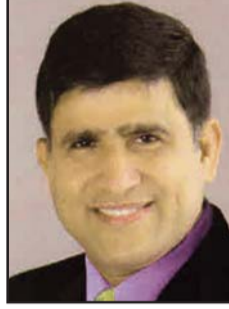
PR. C. C. THOMAS